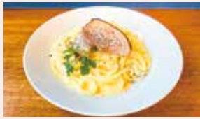
カルボナーラ ¥1300 美味しいので食べてみてください。