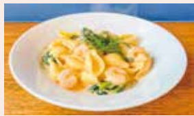
海老の トマトクリーム ¥1300 ググッと濃厚！海老トマトクリーム！