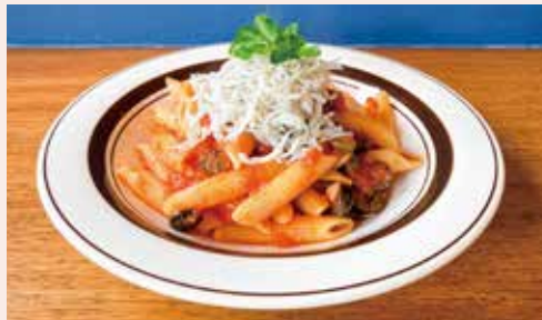
神戸産釜揚げしらすと オリーブのプッタネスカ ¥1300 試作の時からすごい美味しくて、完食しました。