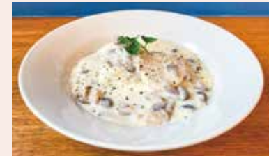
鶏もも肉のフリカッセ ¥1280 手間暇かけてボリリとした鶏肉は柔らか〜い！フォカッチャの追加注文でソースを残さずいただけます。