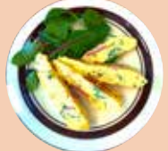
本日の フリッタータ ¥600 オムレツとキッシュの中間のような、具沢山のイタリアン卵料理。