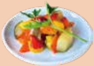
グリル野菜の マリネ ¥500 甘酸っぱい香りとグリル野菜の香ばしさが絶妙なマリネです。