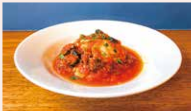
カチャトーラ ¥1280 お手製ソミュール液に浸した鶏モモ肉をトマトソースで煮込んだイタリア・マンマの家庭料理。