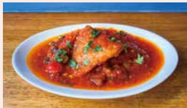
小ぶりな アクアパッツァ ¥1000 魚介だしを効かせたコクのある旨味とトマトの酸味が絶品！食べ切りサイズでちょうど良い！