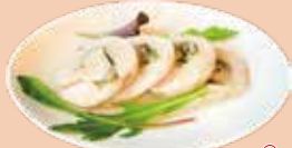
丹波鶏の インボルティーニ ¥800 イタリア語で「巻く」の意。丹波鶏使用。しっとり食感です。