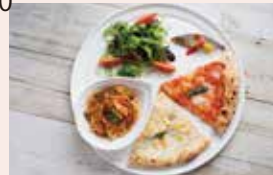
ワンプレートランチ ¥980~ カットピザ、サラダ、前菜、パスタ。ピザは日替わりよりお選びいただけます。