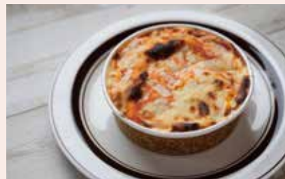
ボロネーゼの ラザニア ¥880 オリジナルソースとボロネーゼを平型パスタで何層にも重ね、ボリューム満点。