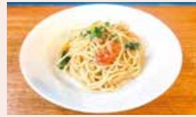
彩り野菜の アラーリオ・オーリオ ¥1300 店主の愛する自家製ソースベースが美味しい！