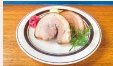
自家製ポルケッタの ピザ窯焼き ¥1380 厚切りポルケッタを豪快にピザ窯で焼く！盛り付ける！どうぞ！召し上がれ！