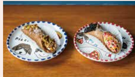
カンノーロ ・ピスタチオ ・チョコチップ 各¥500

イタリア、シチリア島の郷土菓子。アキラッチでは生地から全て手作りしています。中にはよりコッタチーズを使ったオリジナルクリームが入っています。