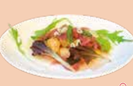
自身魚の カルピオーネ ¥600 サッと揚げた魚をワインビネガーやハーブでマリネしています。