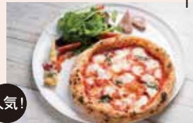
人気! 焼きたてピザランチ ¥1080~ ランチサイズの焼き立てピザ、サラダ、前菜2種。ピザは日替わりよりお選びいただけます。